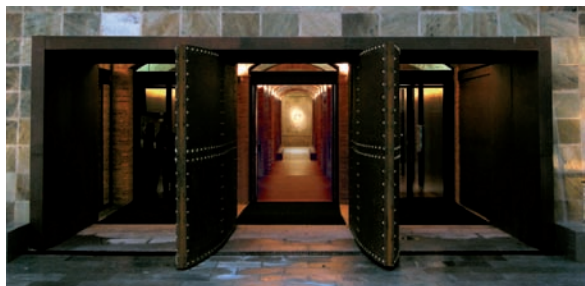
En la página anterior: a) Detalle de la entrada al museo.